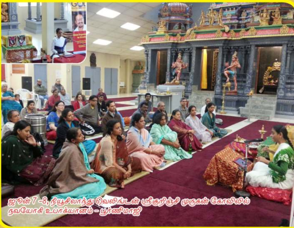
ஜூன் 7 -8, நியூசிலாந்து இவலிங்டன் ஸ்ரீகுறிஞ்சி முருகன் கோவிலில் நவயோகி உபாக்யானம் - பூர்ணிமாஜி