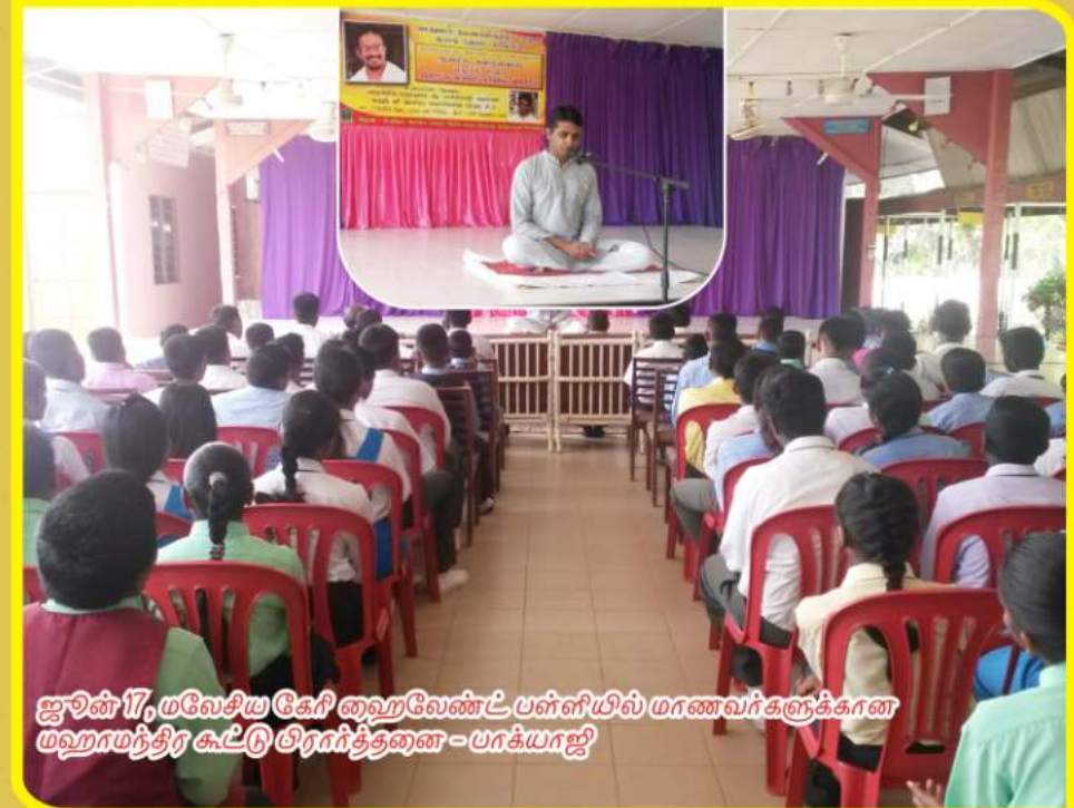
ஜூன் 17, மலேசிய கேரீ ஹைவேண்ட் பள்ளியில் மாணவர்களுக்கான மஹாமந்திர கூட்டு திரைத்தனை - பங்கயாஜி