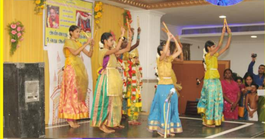
ஜூன் 22, அண்ணா நகர் நாமத்வார் 5ஆம் ஆண்டு துவக்க விழா