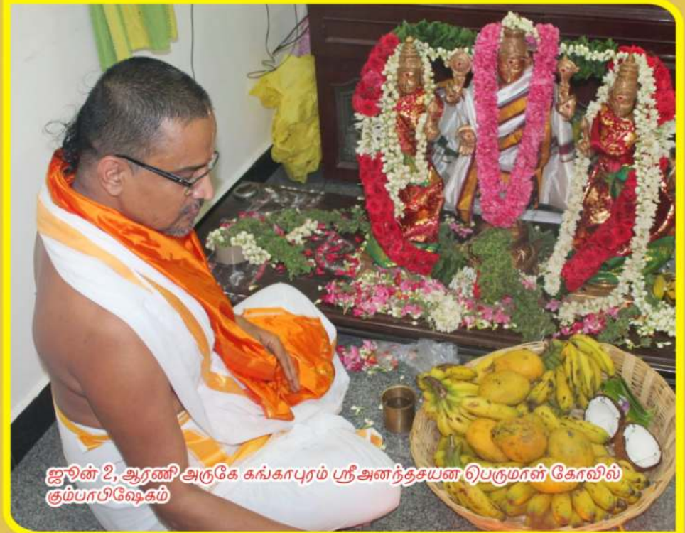
ஜூன் 2, ஆரணி அருகே கங்காபுரம் ஸ்ரீ அனந்தசயன பெருமான் கோவில் சும்பாபிஷேகம்