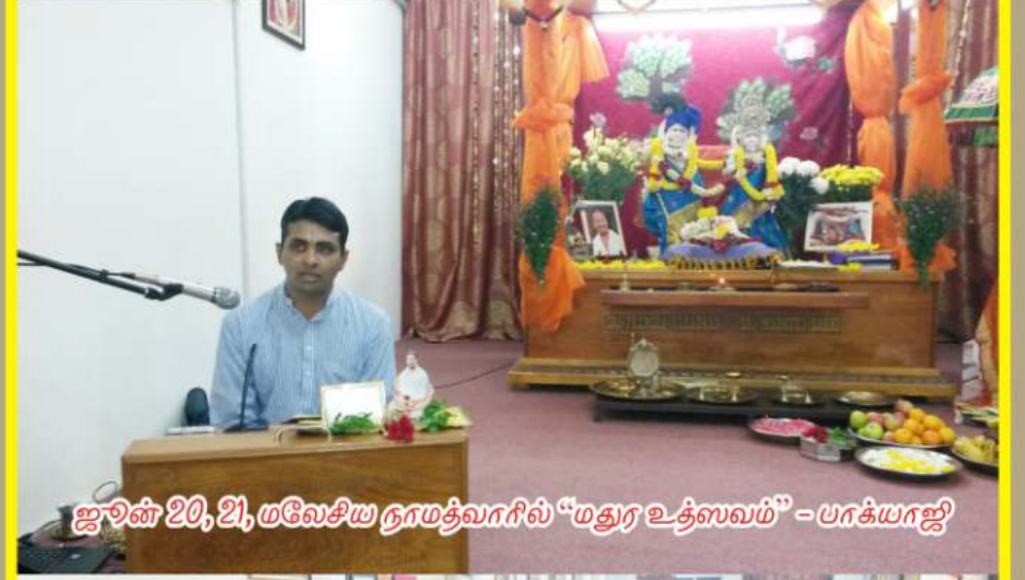
ஜூன் 20, 21, மலேசிய நாமத்வாரில் "மதுர உத்ஸவம்" - பாக்யராஜ்